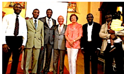
Quelques responsables de l'église