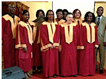
La chorale de l'église